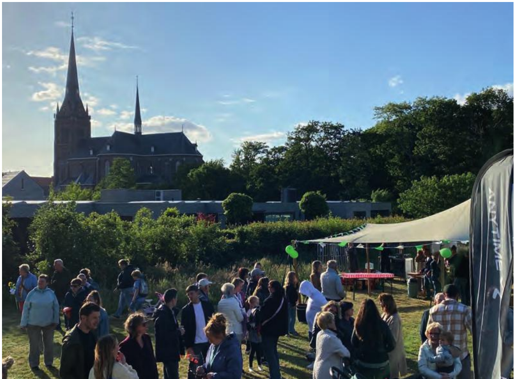
Aankomst van de Avond3daagse