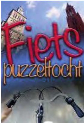
FOTO-PUZZELFIETSTOCHT 2025 georganiseerd door Senioren Haaren Deze foto-puzzelfietstocht is ook voor niet leden van Senioren Haaren!

Door de activiteitencommissie is er een foto/puzzelfietstocht van ong. 46 km. Uitgezet. Deze is vanaf 1 juni t/m 1 oktober te fietsen. Hiervoor moet u wel een inschrijving formulier aanschaffen van € 3,00.